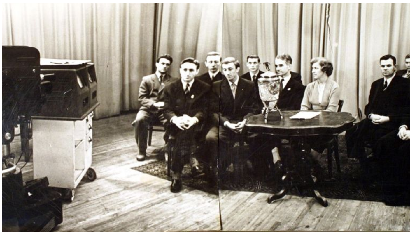
1958 год. Николай СТАРОСТИН со своим "Спартаком" на телевидении.