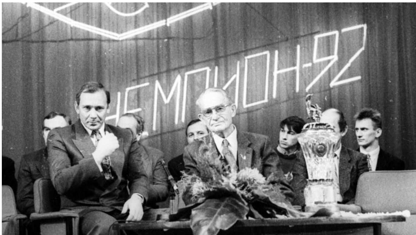
Олег РОМАНЦЕВ и Николай СТАРОСТИН.

– Кивнул: "Да-да, девяносто пять. Мистер, между прочим, руководитель футбольного клуба!" Тот покачал головой: "Невероятно..."