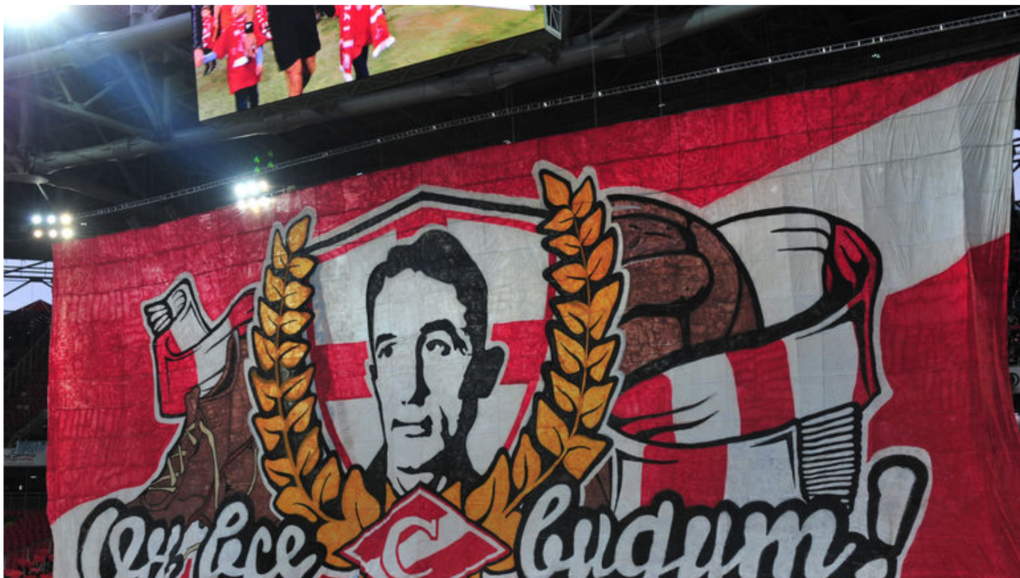
17 мая 2017 года. "Спартак" - "Терек" - 3:0. Перфоман красно-белых.