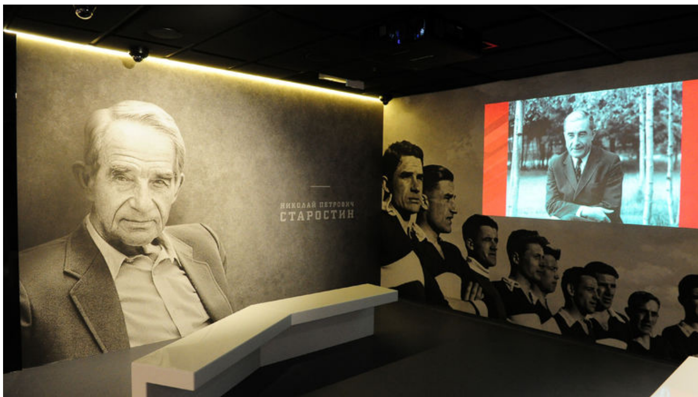
Образ Николая Старостина в музее "Спартака".