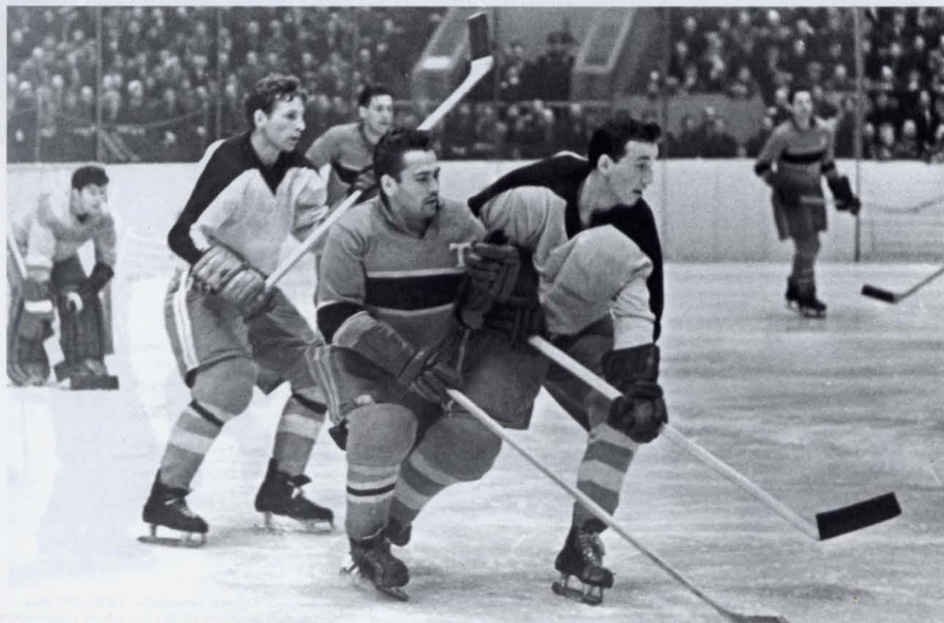
6.04.1962. «Спартак» - «Торпедо» (Горький). Виктор Ярославцев атакует Роберта Сахаровского. Слева - Евгений Майоров. На воротах - Виктор Коноваленко.